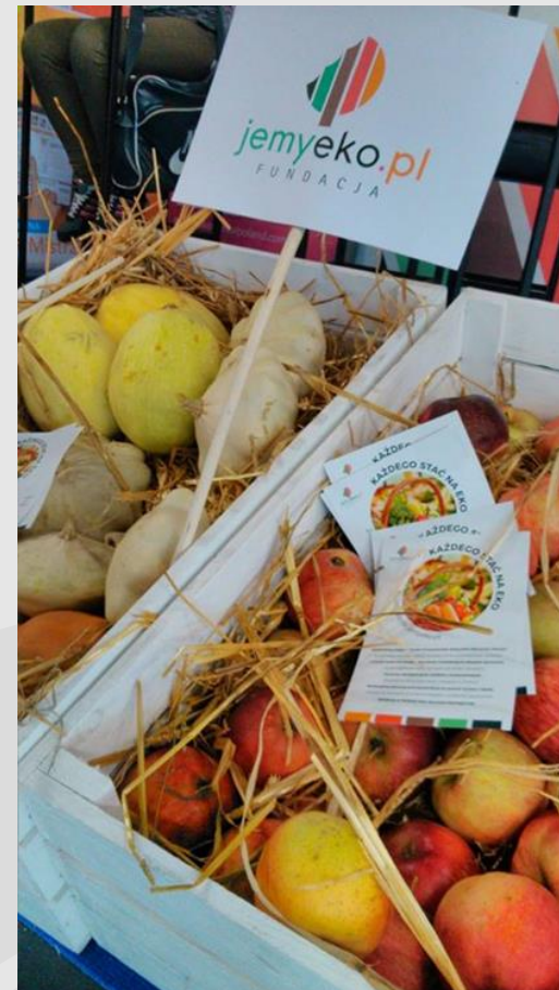
Fundacja JemyEko – (stworzenie sklepu z eko-żywnością) makroregion V