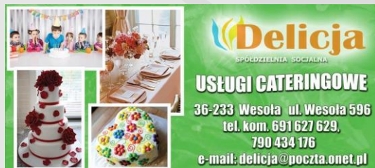
Spółdzielnia Socjalna DELICJA – (stworzenie klubokawiarnio-pizzerii) – makroregion II