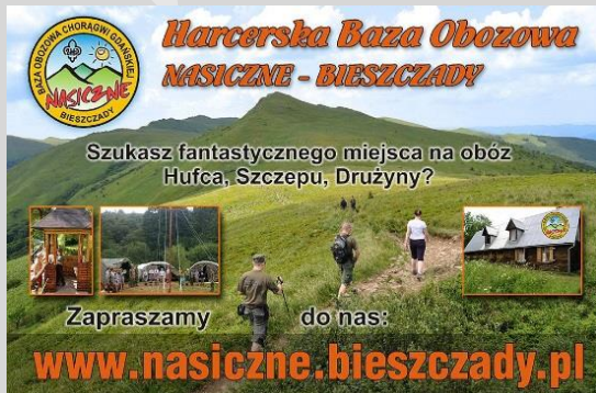
Stowarzyszenie Chorągwi Gdańska ZHP (remont harcerskiej bazy obozowej) – makroregion IV