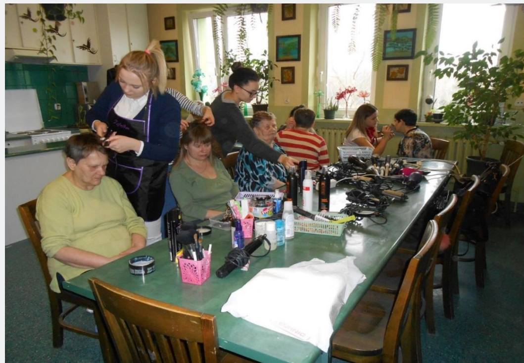
TERAPIA ZAJĘCIOWA - Wizyta w Domu Pomocy Społecznej – przygotowania do zabawy andrzejkowej, HP W CHEŁMIE