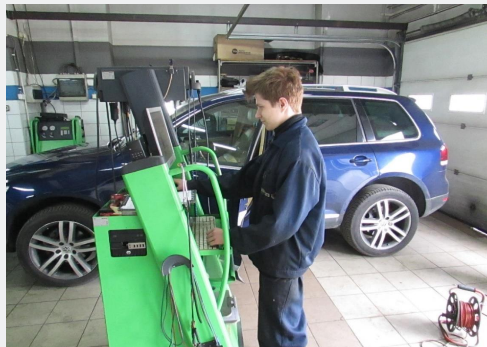
KURS ZAWODOWY – PODSTAWOWA OBSŁUGA STEROWNIKÓW POJAZDÓW SAMOCHODOWYCH – ŚHP WŁODAWA