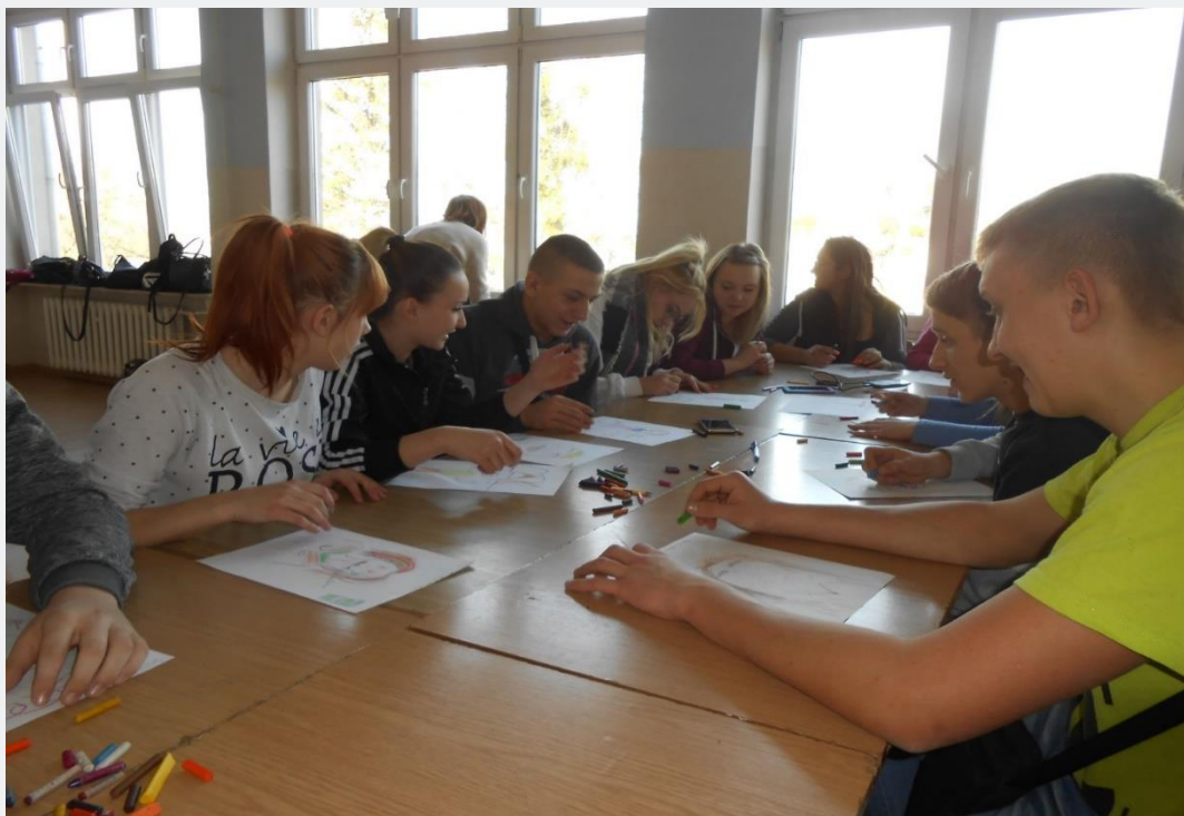
ZAJĘCIA INTEGRACYJNE Z PSYCHOLOGIEM – HP W CHEŁMIE