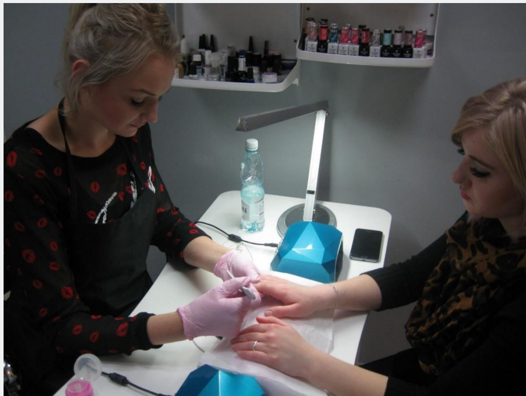
KURS ZAWODOWY – Wizaż ze stylizacją paznokci – HP w Biłgoraju