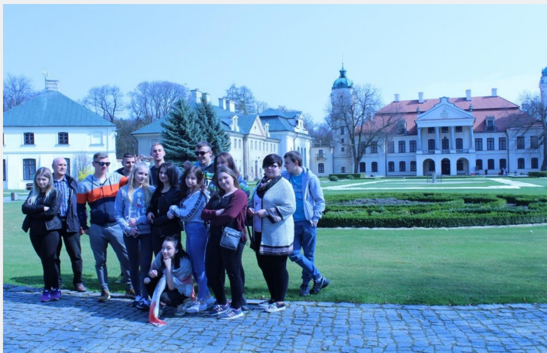
ARTETERAPIA – KOZŁÓWKA – OSIW ZAMOŚĆ