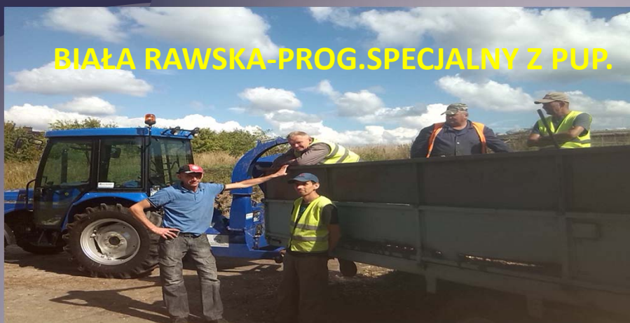
BIAŁA RAWSKA-PROG.SPECJALNY Z PUP.