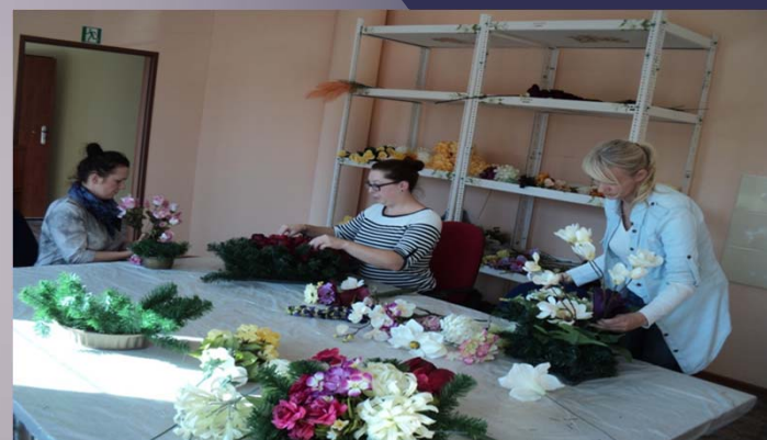
Pracownie rękodziela artystycznego