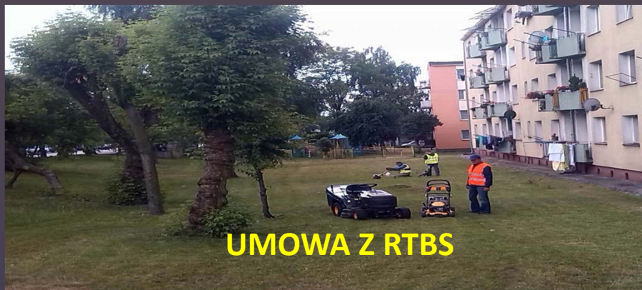
UMOWA Z RTBS