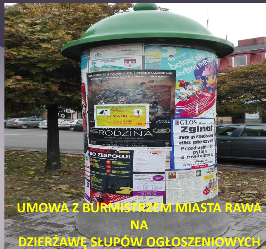
UMOWA Z BURMISTRZEM MIASTA RAWA NA DZIERŻAWĘ SŁUPÓW OGŁOSZENIOWYCH