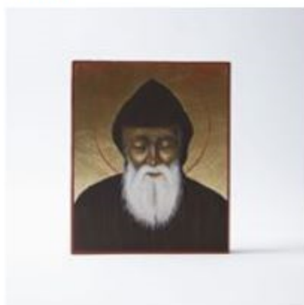
Ikona "Święty Charbel" 250,00 zł