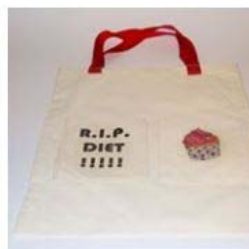
Torba 22,00 zł