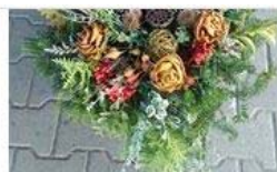
Stroik na Wszystkich Świętych 50,00 zł