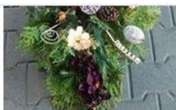
Stroik na Wszystkich Świętych 78,00 zł