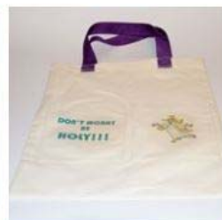
Torba 22,00 zł