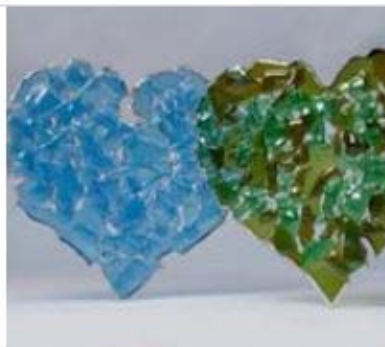
Szklane serca 60,00 zł