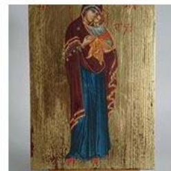
Pop Ikona 70,00 zł