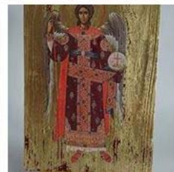
Pop Ikona 70,00 zł