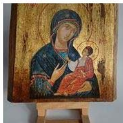
Pop Ikona 70,00 zł