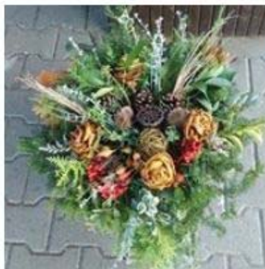
Stroik na Wszystkich Świętych 50,00 zł