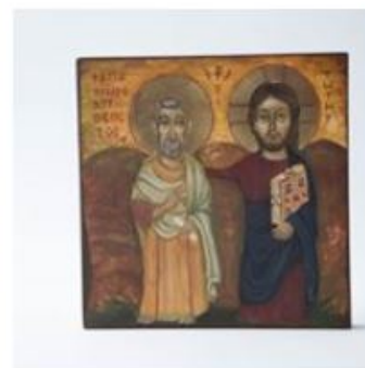
Ikona "Jezus i Przyjaciół" 300,00 zł