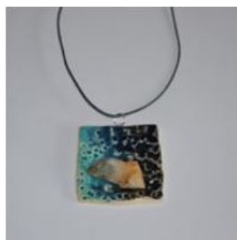
Wisiory Ceramiczny Kryształ ... 30,00 zł