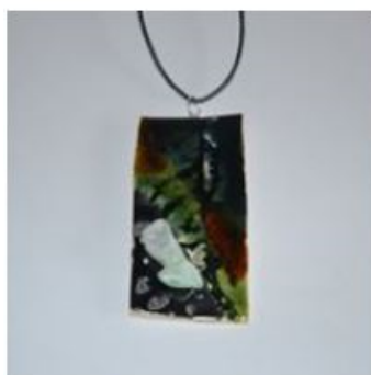
Wisiory Ceramiczny Chryzopras 30,00 zł