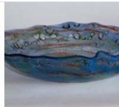
Szklana miska 60,00 zł