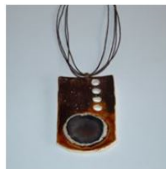
Wisiory Ceramiczny Agat 35,00 zł