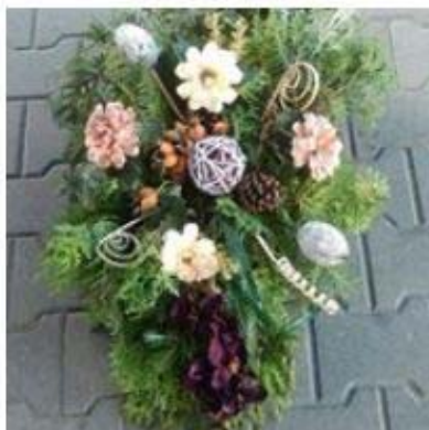
Stroik na Wszystkich Świętych 78,00 zł