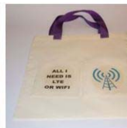
Torba 22,00 zł