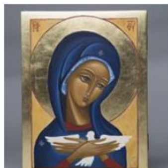
Ikona "Pneumatofora" 400,00 zł