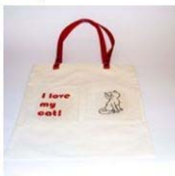
Torba 22,00 zł